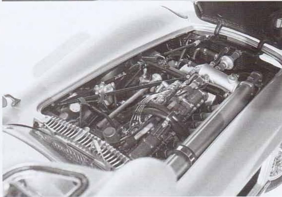
Wir sammeln Modellautos mit dem Stern

unter der von einer dünnen Metallstange gehaltenen Motorhaube versteckt. Hier erahnt man schon, woher die Zahl von 1817 Teilen an diesem Modell herkommt. Auch das Chassis des Modells strotzt nur so vor Details, wenn man es vorsichtig auf den Kopf dreht.