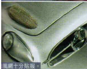
三網十分貼服， 亦不存嚴重膠感。