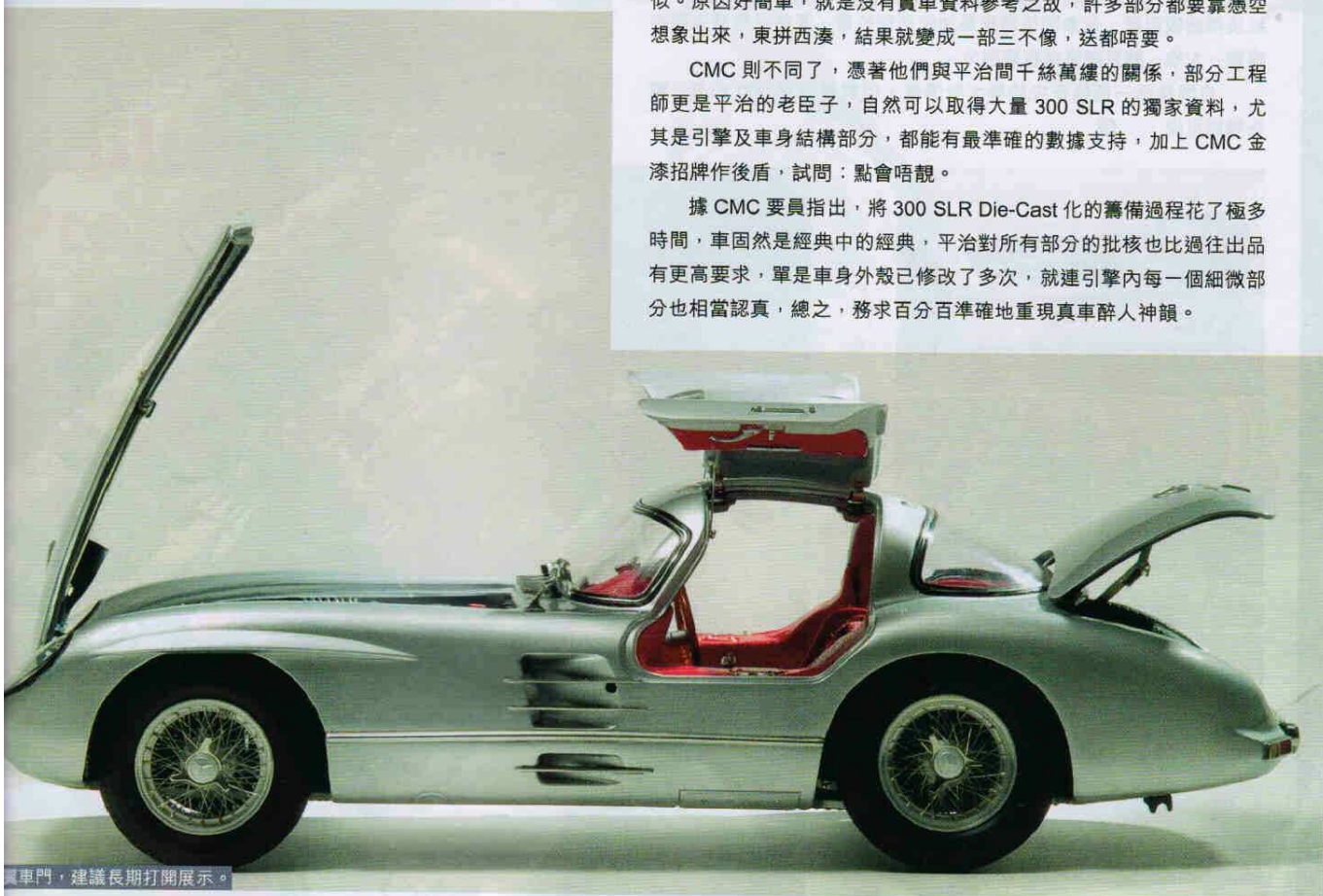
鷗翼車門，建議長期打開展示。

據 CMC 要員指出，將 300 SLR Die-Cast 化的籌備過程花了極多時間，車固然是經典中的經典，平治對所有部分的批核也比過往出品有更高要求，單是車身外殼已修改了多次，就連引擎內每一個細微部分也相當認真，總之，務求百分百準確地重現真車醉人神韻。