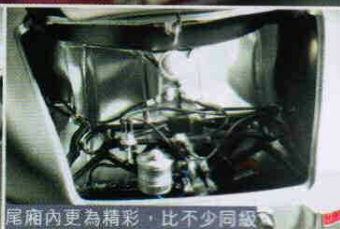
尾廂內更為精彩，比不少同級 模型的引擎部分還要精密。